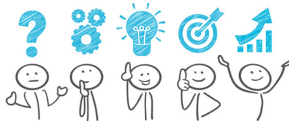
Foto: © pressfoto - Freepik, Zeichnung: © Matthias Enter - stock.adobe.com

Je nach spezifischer Bedarfslage weisen die CM auf bestehende Beratungsangebote in Ihrer Umgebung hin und arbeiten mit allen Institutionen im Sozialraum zusammen.